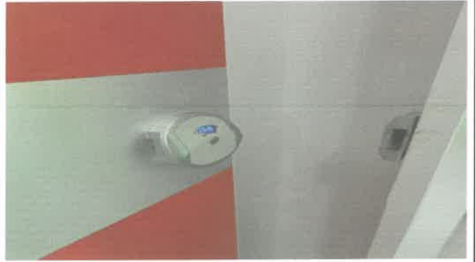
3층 여자화장실 잠금장치 보수