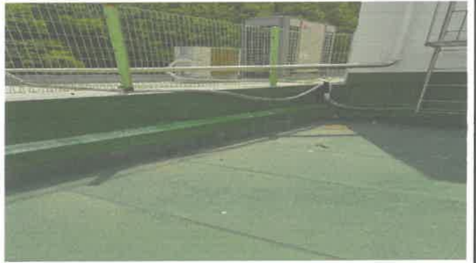
기계실 및 옥상 외벽 부분도색