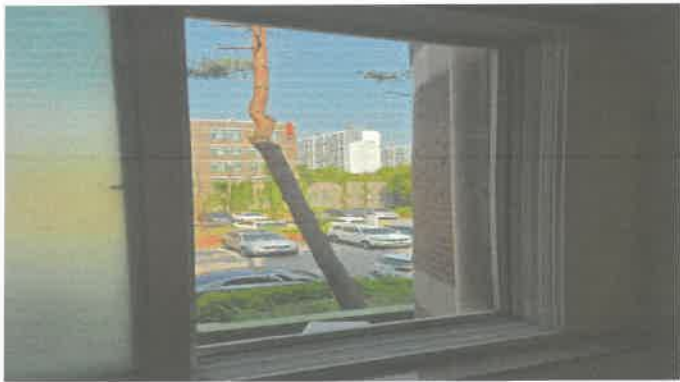
2층 주차장쪽 방충망 교체