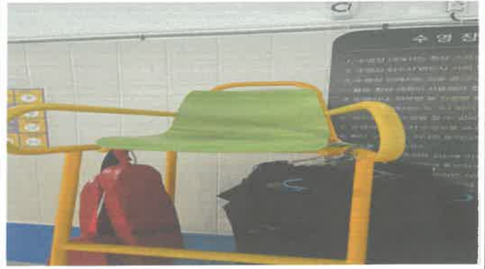
수영장 안전요원 의자 교체